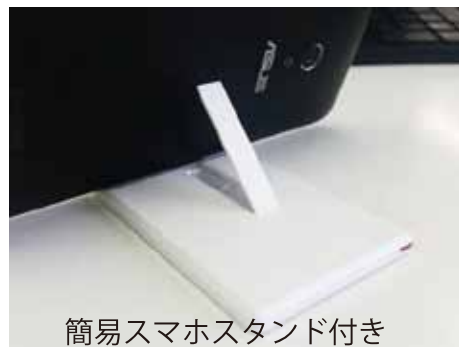
簡易スマホスタンド付き