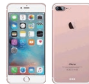
for iPhone6/6s & iPhone7