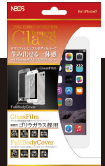
パッケージイメージ

ガラスフィルムとフルボディカバーで 生み出せる一体感 ~iPhoneをフルプロテクション~